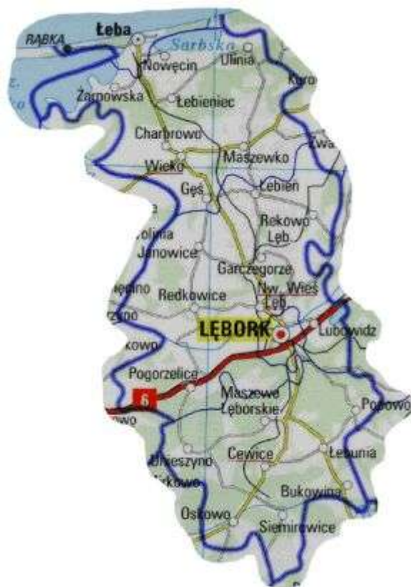
Rys. 1 Mapka powiatu lęborskiego

Główne sektory gospodarki to handel, usługi, rolnictwo i turystyka.