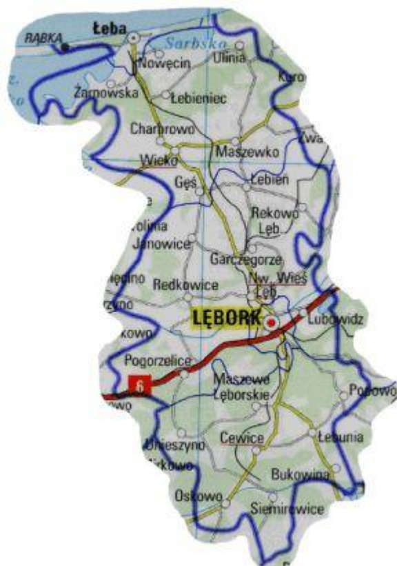
Rys. 1 Mapa powiatu lęborskiego

Główne sektory gospodarki to handel, usługi, rolnictwo i turystyka.