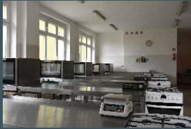
Pracownia gastronomiczna i cukiernicza

W ramach zajęć szkolnych nasi uczniowie uczą się zawodu na przedmiotach teoretycznych oraz praktycznych- w pracowniach wyposażonych zgodnie z nauczanyam zawodem.