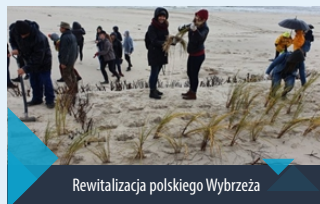
Rewitalizacja polskiego Wybrzeża

I Liceum Ogólnokształcące w Łęborku posiada: „Złotą odznakę” zadowolonego konsumenta, przyznaną przez Europejskie Centrum Nadzoru.