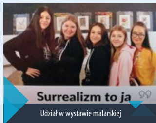
Surrealizm to ja