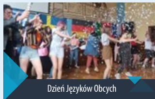
Dzień Języków Obcych